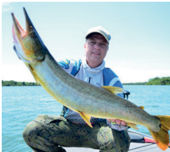
Exemplar de bicuda capturada no Rio Tocantins, município de Lajeado – TO.

Considerada o “torpedo do rio” a bicuda é uma espécie muito esportiva e atrai os amantes da pesca. Sua distribuição ocorre nas Bacias Amazônica e Araguaia-Tocantins. Quando capturada proporciona ao pescador esportivo inúmeros saltos e acrobacias, sendo um exemplar difícil de embarcar devido ter a boca muito dura e dificultar a entrada da garatêia ou anzol. Quando embarcada, deve ser manipulada