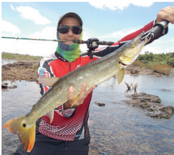
Exemplar de bicuda capturada no Rio Tocantins, município de Lajeado – TO.

mais rápido possível para registro fotográfico pois é uma espécie muito frágil a manipulação. Recomenda-se a utilização de caniços entre 17 a 20 libras, linha multifilamento de 30 libras, leader de mesma espessura e iscas artificiais variadas. Seu tamanho mínimo de abate é de 40 centímetros, porém, seguindo as mesmas questões da cachorra larga, não é recomendado o seu abate, buscando a preservação da espécie para fins esportivos.