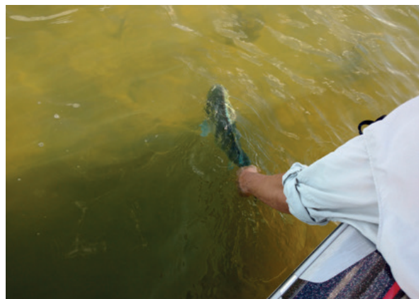
Soltura de exemplar de tucunaré-azul: momento ápice da pesca esportiva.

plar que proporcionou tanta alegria. Neste momento o praticante da pesca esportiva deve colocar o peixe na posição horizontal, mantendo sempre a boca voltada para a correnteza. Nunca realizar o movimento de vaievém, pois dessa maneira modificamos a forma de entrada natural da água, podendo ocasionar o comprometimento das brânquias (guelrras). Recomenda-se a soltura do exemplar apenas após total recuperação do mesmo.