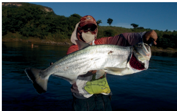
Exemplar de cachorra longa capturada no Rio Tocantins, município de Lajeado – TO.

“vampira”, a espécie é muito apreciada pelos pescadores esportivos por sua agressividade nos ataques, saltos espetaculares e brigas de fazer o seu “rival” suar a camisa. Recomenda-se a utilização de caniços de 20 a 25 libras, linhas multifilamento de 40 libras, leader de mesma espessura, iscas artificiais diversas e dentro das iscas naturais a tujira é uma das suas preferidas. Seu tamanho mínimo de abate no estado é de 50 centímetros, porém não é recomendado o abate da espécie para fins de consumo devido a mesma possuir uma grande quantidade de espinhas em formato de “Y”.